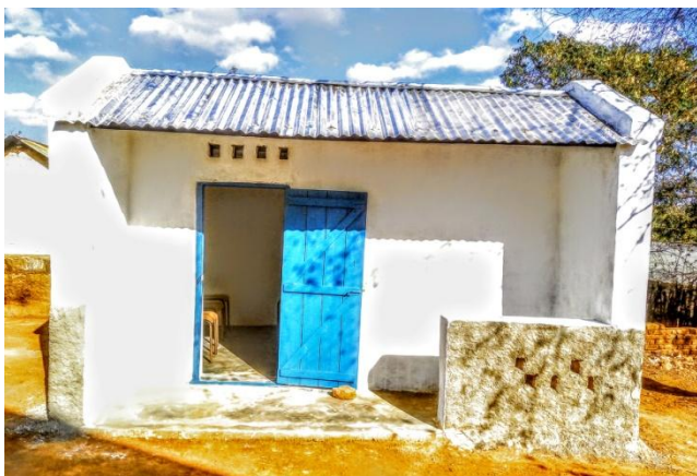
Nouvelle maison du gardien du CCIC