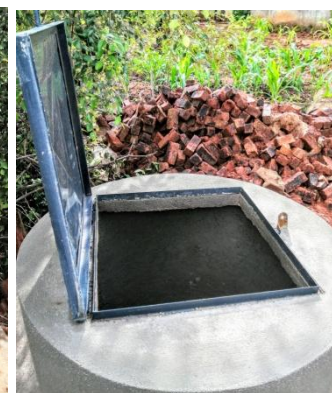
Rénovation du puits