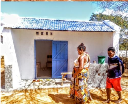
Construction –Maison du gardien